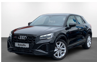
Bataille Service neu erleben